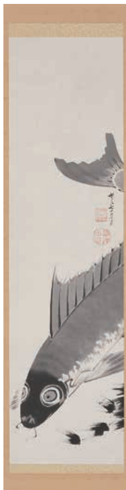
伊藤 若冲 「鯉図」 紙本 水墨 本紙112×30cm 全体196×44cm ¥3,500,000~