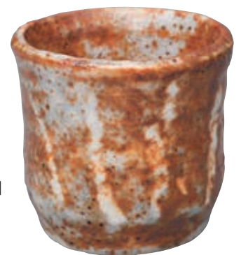
北大路 魯山人 「志野さけのみ」 共箱(前田友斎箱) H4.8×W5.0cm ¥500,000~

今年3月より一般の方から出品作品を募り、日本全国から集まった作品点数は、掛軸だけではなく、陶芸から工芸品、着物まで約250点。これら美術品を加島美術が所定の審査を行った上で最低入札価格を設定し、一般の方が下見会に参加した上で、購入希望価格を入札するというものです。これによって、より多くの方に気軽かつ適正と考える価格で美術品を購入していただくことができます。