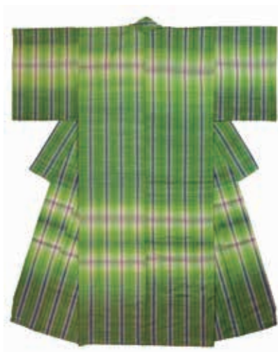
志村 ふくみ 「杜若」 仮絵羽 身丈171cm 袖丈53cm 桁丈67cm 前巾29cm 後巾32cm コンディション 良好 九〇〇、〇〇〇円