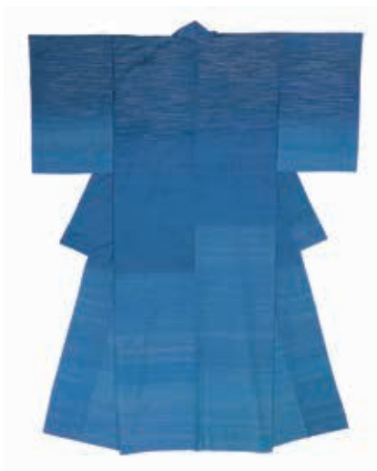
志村 ふくみ 「蒼穹」 仮絵羽 身丈173cm 袖丈57cm 桁丈67cm 前巾28cm 後巾32cm コンディション 良好 一、〇〇〇、〇〇〇円