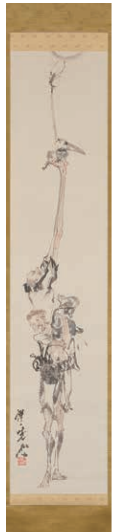
河鍋 暁斎 「手長足長」 紙本 着色 本紙137×30cm 全体204×42cm ¥1,000,000~