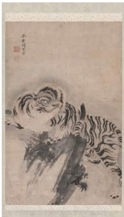
円山 應挙 「虎図」 紙本 水墨 特別展「円山應挙〈写生画〉創造への挑戦」出品 府中市美術館「かわいい江戸絵画」展出品 『別冊太陽 日本のこころ-205「円山応挙 日本絵画の破壊と創造」』所載 本紙85×55cm 全体182×70cm ¥2,000,000~