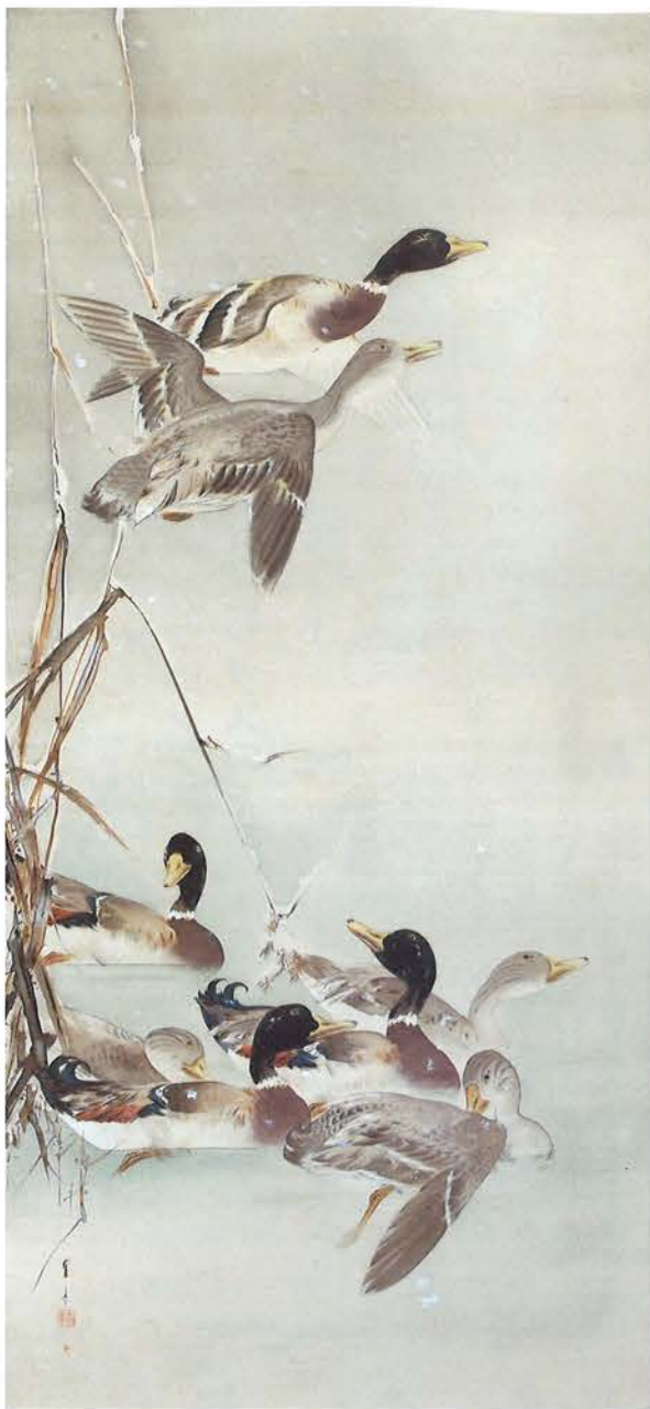
図4 雪中之鴨図 明治30年代頃 絹本着色・軸 149.0×70.0cm 個人蔵

4の《雪中之鴨図》は、その清方が生前こよなく愛し大切にしていた作品だ。ここに掲出した作品を含む省亭の貴重な花鳥画が、この春、京橋の加島美術ギャラリーに一堂に集まるといふ。二列目ど真ん中に生きた省亭の生き様とその作品を、私も行く春と共に堪能したいと思つている。