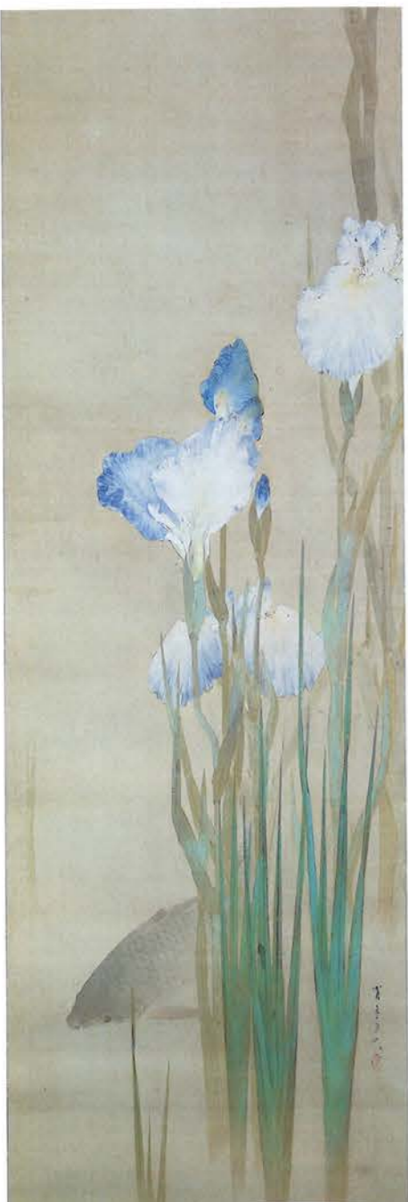
図2 花菖蒲に鯉魚図 明治20年代前半頃 絹本着色・軸 116.0×40.0cm 個人蔵

絵の師匠となった菊池容斎(一七八八〜一八七八)は、当時もう既に八〇歳の老人だったが、狩野派 かのの を基礎として円山四条派や浮世絵風、やまと絵から果ては洋風画まで学んで、それらを折衷し、「容斎風」といわれた覇気のある独自の作風を打ち立てた近代画家の先駆けのような絵師(画家)だった。新奇好きで科学的な指向をもっていた容斎が、省亭たち門弟に施した絵の修練もまた一風変わったものだった。例えば、容斎に随行した省亭が町で見かけた人物の着物や柄や髪の様子がどうだったか、後で師匠から諮問を受け、すらすら答えられないと大目玉をくらったという。しかし次からは見たものを眼に焼き付けるようになり、これが写生の力を養うのに役立つと回想している。