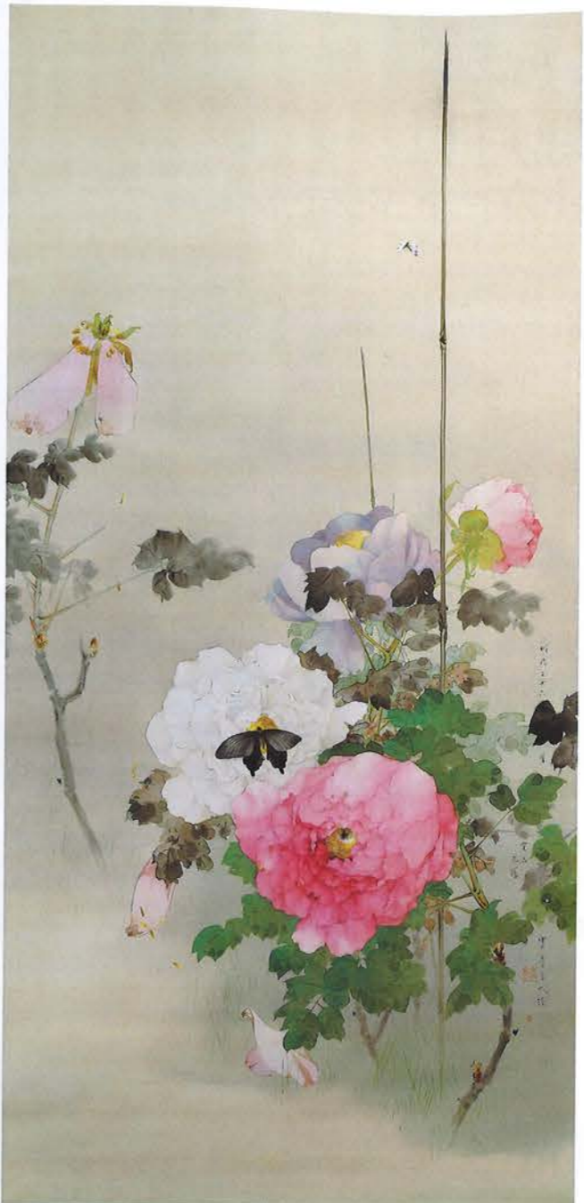
図1 牡丹に蝶の図 明治26(1893)年 絹本着色・軸 143.6×69.4cm 個人蔵

まずは、図1の《牡丹に蝶の図》からご覧頂きたい。日本画の技法で言うと、いわゆる没骨法 もつこぼう といって輪