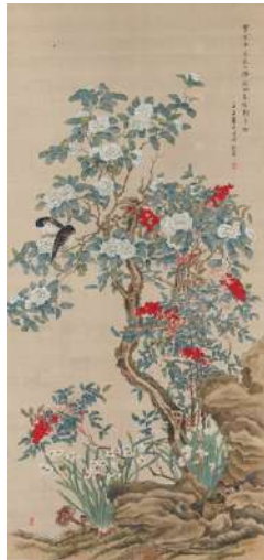
椿椿山「歳寒三友図」 《最低入札価格》¥1,800,000