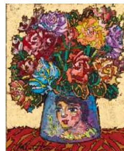
絹谷幸二「黄金背景薔薇」 《最低入札価格》 ¥2,000,000