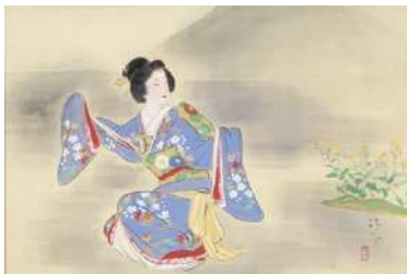
鍋木清方「夜の不二 道行旅路荅簪」 《最低入札価格》¥800,000