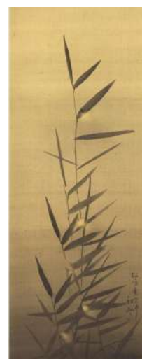
小早川秋聲「蛭図」 《最低入札価格》 ¥80,000

「廻 -MEGURU- オンライン」 : https://www.meguru-online.jp