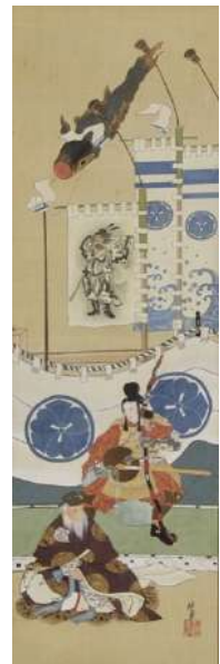
河鍋暁翠「端午の節句図」 《最低入札価格》¥100,000