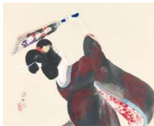
伊東深水「追羽子」 《最低入札価格》¥800,000

江戸情緒あふれる美人画、風俗画で一世を風靡した巨匠・鍋木清方。その繊細で気品に満ちた画風、内面の美を描き出すような表現力は、観る者を惹きつけてやみません。清方は多くの門人を育てたことでも知られています。今回は「清方門下三羽鳥」と称される伊東深水、山川秀峰と寺島紫明に加え、伊東深水に師事した岩田専太郎など、清方の系譜を感じられる作品20点が集まりました。