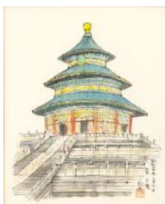
平山郁夫「北京・天壇」 《最低入札価格》 ¥2,500,000