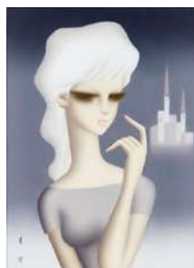
東郷青児「遠い城」 《最低入札価格》 ¥1,200,000