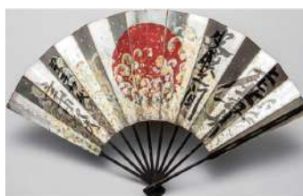
三島由紀夫「虚實皮膜之間」 《最低入札価格》 ¥550,000