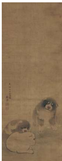
円山應挙「狗児図」 《最低入札価格》 ¥680,000