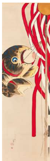
渡邊省亭「端午」 《最低入札価格》 ¥1,200,000