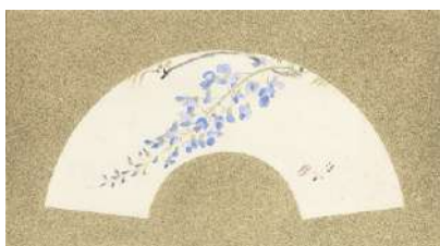
錦木清方「ゆかりの花」 《最低入札価格》 ¥60,000

下見会期間中、特別企画としてライブオークション「廻 -MEGURU- オンライン」で開催中の第48回オークションの作品を、第二会場にて特別展示いたします。下見会と併せてご高覧ください。