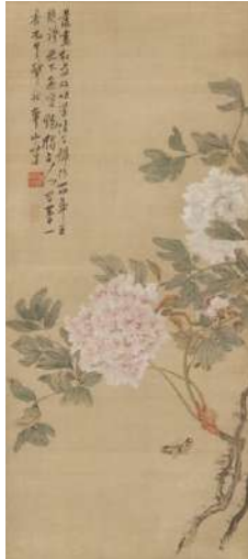
渡邊華山「紅白牡丹図」 《最低入札価格》¥1,000,000

従来の日本美術史観を覆し、現代の日本美術ブームの大きな契機となった辻惟雄著『奇想の系譜』。以降、本書で取り上げられた作家は揺るがぬ評価を獲得し、強烈な個性と圧巻の画技により観る者を魅了し続けています。今回は奇想の画家を代表する伊藤若冲、曾我蕭白、長澤蘆雪の優品約10点を出品します。