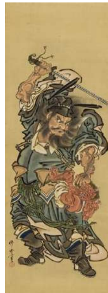
河鍋暁斎「鍾馗挫鬼之図」 《最低入札価格》¥1,500,000

江戸後期、谷文晁の門下で画技を磨き、文人画の大家として名を馳せる渡邊華山と椿椿山。渡邊華山は自然観察と写生を主としつつ、西洋や中国の技法を取り入れた独自の画風を確立しました。華山を慕った椿椿山は、その画風を受け継ぎながら豊かな装飾性を備えた様式を完成させます。当時の文人画に新生面を切り拓いた華山と椿山に加え、両者の流れを汲む同時代の画家たちに着目します。