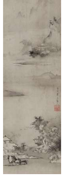
曾我蕭白「水墨山水図」 《最低入札価格》¥700,000