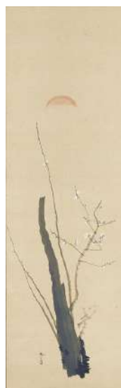
菱田春草「旭梅」 《最低入札価格》 ¥1,200,000