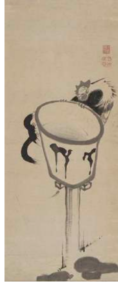
伊藤若冲「提灯鶏図」 《最低入札価格》¥3,500,000

江戸情緒あふれる美人画、風俗画で一世を風靡した巨匠・鍋木清方。その繊細で気品に満ちた画風、内面の美を描き出すような表現力は、観る者を惹きつけてやみません。清方は多くの門人を育てたことでも知られています。今回は「清方門下三羽鳥」と称される伊東深水、山川秀峰と寺島紫明に加え、伊東深水に師事した岩田専太郎など、清方の系譜を感じられる作品20点が集まりました。