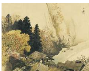
川合玉堂「古驛深秋」 《最低入札価格》 ¥1,600,000