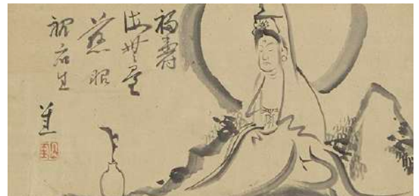
仙厓義梵「楊柳観音図」 《最低入札価格》 ¥480,000～

“仙厓さん”の愛称で親しまれる禅僧・仙厓義梵は、江戸時代に市井の人々との交わりを通して教えを説き、数々の禅画を残しました。近年、複数の美術館で企画展が催され、ユーモラスで愛らしい作品は時代を超えて人々に支持され続けています。脱力感のある作風の中に覗く、確かな禅の教えを、どうぞご堪能ください。