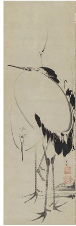
伊藤若冲「雙鶴図」 《最低入札価格》 ¥1,800,000～