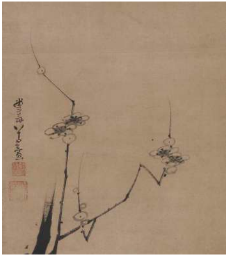
伊藤若冲「墨梅図」 《最低入札価格》 ¥900,000～