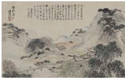
松村呉春画 高芙蓉賛