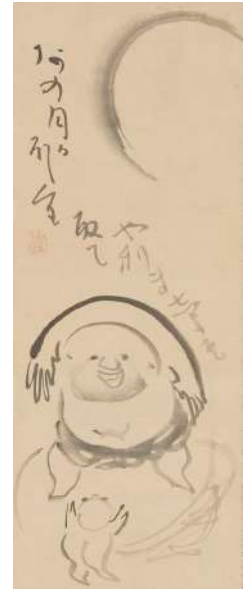
仙厓義梵「布袋画讃」