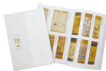
カタログイメージ

→ https://www.meguru-auction.jp/item/ （2022年1月下旬公開予定）