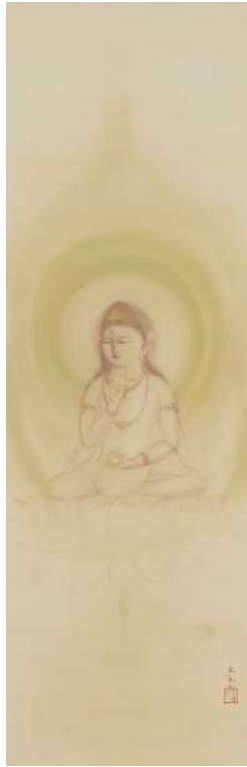
村上華岳「蓮華座上の菩薩」 《最低入札価格》 ¥3,300,000～