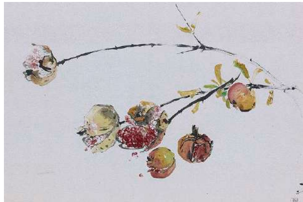
田中一村「石榴図」 《最低入札価格》 ¥3,000,000～