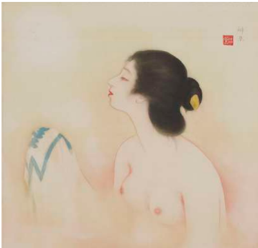
岡本神草「浴」 《最低入札価格》 ¥1,000,000～