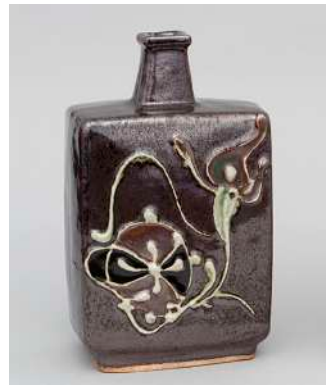
河井寛次郎「鐵袖筒描花文扁壺」 《最低入札価格》 ¥800,000～