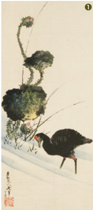
① 葛飾北斎「水草鶴図」 紙本 着色 本紙61×28cm / 全体151×39cm ¥16,000,000