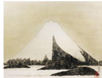
前田 青邨「富士」 紙本 着色 共板 額装 本紙58×83cm / 全体82×108cm ¥6,000,000