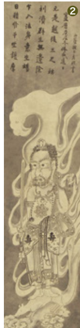
② 白隠慧鶴「越後三尺坊図」 紙本 水墨 淡川康一箱書 本紙122×29cm / 全体210×40cm ¥7,800,000