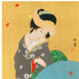
上村 松園「紅葉」 色紙 金地絹本 着色 額装 東美鑑定証書 全体51×47cm ¥7,000,000

約1年半ぶりの開催となる今回の「美祭 撰」では、選りすぐりの作品約55点を出展いたします。どれも加島美術が自信を持ってお届けする優品ですが、中でも今回の注目作品は葛飾北斎の肉筆画「水草水鶏図」、狩野一信「獅子落子図」、前田 青邨「富士」。その他にも、松尾芭蕉、白隠慧鶴などの筆跡、上村松園、伊東深水、小野竹喬などの近代絵画といった、珠玉の作品を取り揃えております。