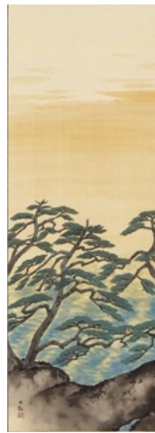
横山大観「東海乃朝」 《最低入札価格》¥3,800,000