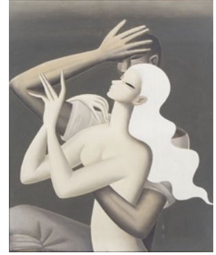
東郷青児「男女像」 《最低入札価格》¥2,000,000