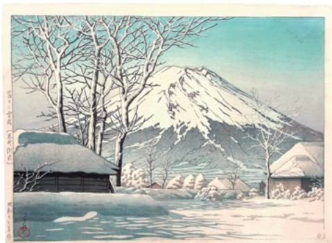
川瀬巴水「富士の雪晴 (忍野附近)」 《最低入札価格》¥450,000

明治以降、西洋の写真や印刷技術の流入により、衰退の一途を辿った浮世絵木版画は、明治後期に版元・渡邊庄三郎が中心となり再興を遂げていきます。洗練を極めた江戸の木版技術を受け継ぎつつ、透明感のある色彩や叙情的な風景表現といった新たな感性を通して発展したこれらの作品は新版画と呼ばれ、今なお多くの人を魅了しています。川瀬巴水、吉田博、笠松紫浪、など新版画を代表する作家たちの作品群をご堪能ください。