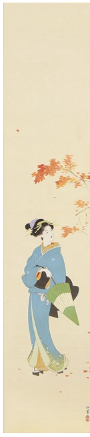
上村松園「志具」連 《最低入札価格》¥7,000,000