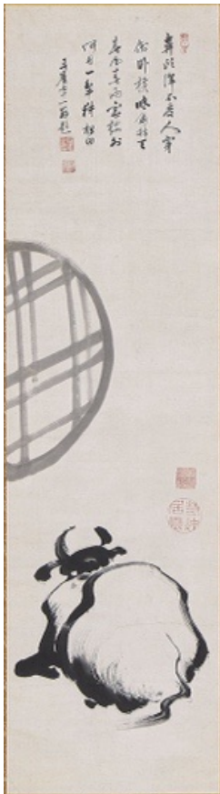
伊藤若冲画 無染浄善贊「円窓牛図」 《最低入札価格》¥2,500,000