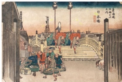
歌川広重「東海道五拾三次之内 日本橋 朝之景」 《最低入札価格》¥28,000

歌川広重が一躍脚光を浴びるきっかけとなった名所絵「東海道五十三次」を特集いたします。季節や気候、時刻の変化を巧みに描き、人と自然が織りなす風景を情緒豊かに写し出した広重の作品は、当時の江戸の人々に旅への憧れを抱かせるものだったに違いありません。今回、全五十五図のうち、四十二図を出品いたします。