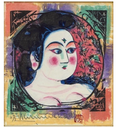
棟方志功「なでしこの柵」 《最低入札価格》¥7,000,000