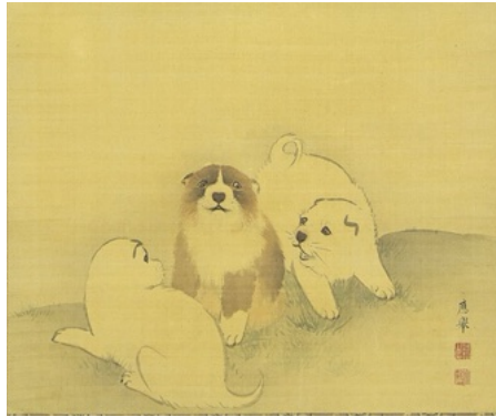
円山應挙「狗子図」 《最低入札価格》¥3,800,000