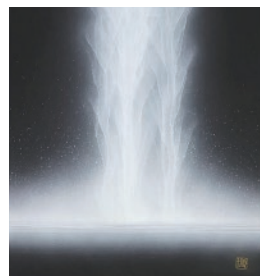
千住博《ウォーターフォール》