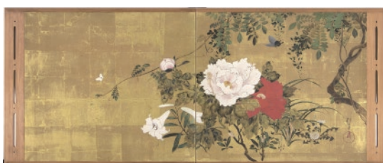
酒井抱一《春花蝶図》