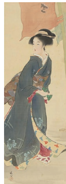
鎌木清方《芝居の前》