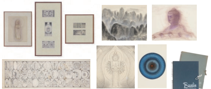
《一括資料》※一部抜粋